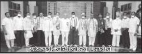
આચાર્યશ્રી, અતિથીશ્રીઓ તથા દાતાશ્રીઓ