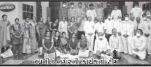
નવનીત નગરની કાર્યકર્તા ટીમ